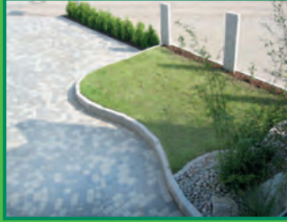
PLATTEN & PFLASTERBELEGE