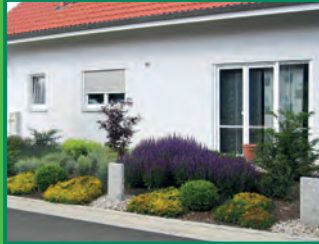
PFLEGE & AUSSENANLAGEN